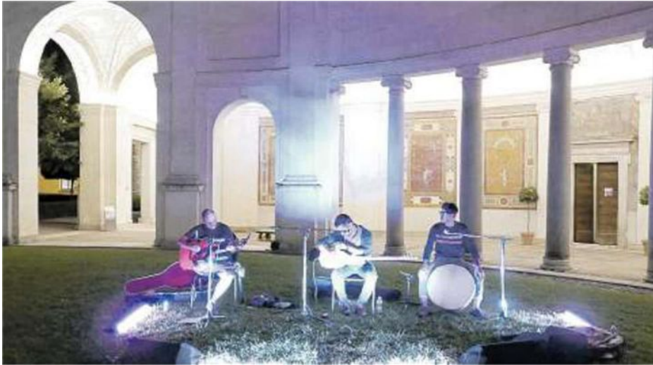
Di fianco, l'ingresso alle Terme di Caracalla con un'opera di Mauro Staccioli. Più a sinistra, concerto nel cortile del Museo Etrusco di Villa Giulia