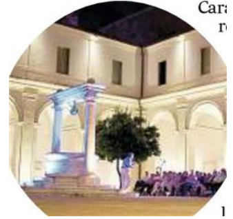
Sopra, spettacolo nel piccolo chiostro delle Terme di Diocleziano