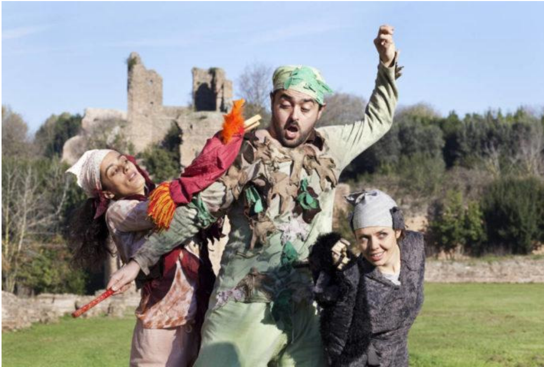
Nascita di Roma